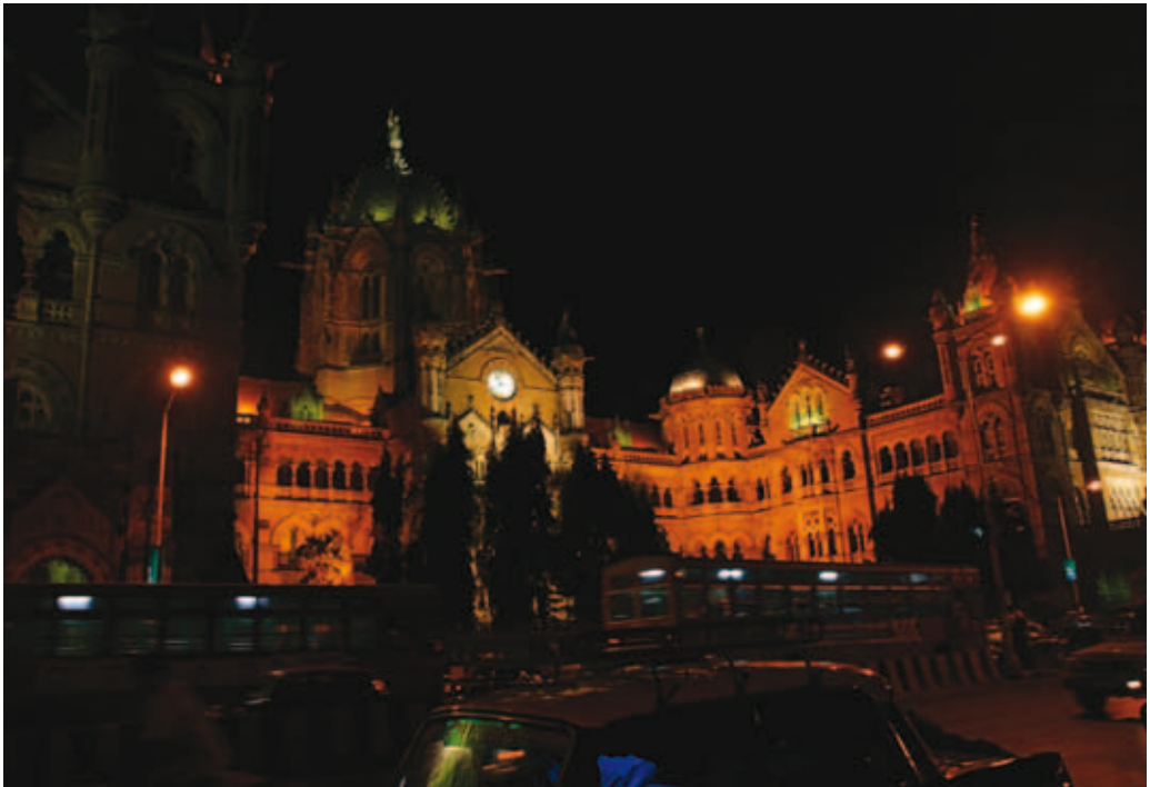
Mumbain kuuluisa rautatieasema.