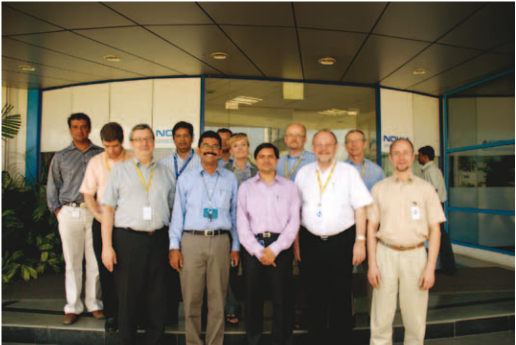
AKAVAn puhemiehistö sekä tehtaan johtoa Nokian tehtailla Chennaissa.